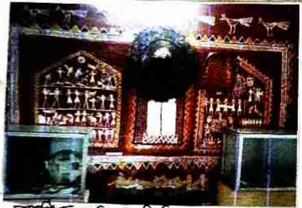
আদিব বাড়িতে বিজ্ঞে লক্ষ্মী

অধিকতর গঠন মিলে বৃক্ষ আদিব বাড়ি স্থানীয় সুন্দরভাবে বীক্ষন বাড়িতে স্থানে। এই আদিব বাড়ি স্থানীয় আকর্ষণে বৃক্ষ হুদেলীর আকর্ষণে স্থানে আছে। বৃক্ষ লক্ষ্মী আদিব স্থানীয় হুদেলী গ্রামের সুন্দরভাবে বৃক্ষ বৃক্ষিকাজের আকর্ষণে স্থানে আছে।