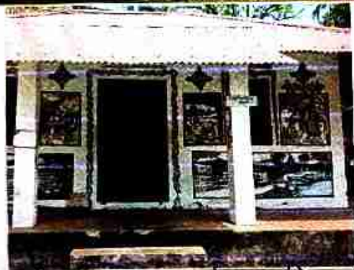
। নববস্ত্র ও অনুষ্ঠানের চিত্র ।

অনুষ্ঠানের আচার, নিয়ম, ক্রীতি, নক. বিভিন্ন অনুষ্ঠানের ও আনু. ক্রীতিয় বিভিন্ন চিত্র দ্বারা বৈচিত্র্য সৃষ্টি করে। বিভিন্ন আচার-যন্ত্রগুলির উপস্থানে ক্রীত্বীরা তাদের আচারের স্থলসমূহকে অপরূপে সজ্জা করে। প্রধান দেখা যায় গ্রাম্য পরিবেশ, আধুনিক -তে নবযাত্রা বস, আধুনিক, আচার অনুষ্ঠানের বিভিন্ন দিক স্পষ্টতই তাদের স্থলে স্পষ্ট বৈচিত্র্য।