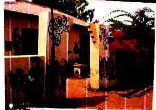
। জীব জন্তু, পশু-পাখির চিত্র ।