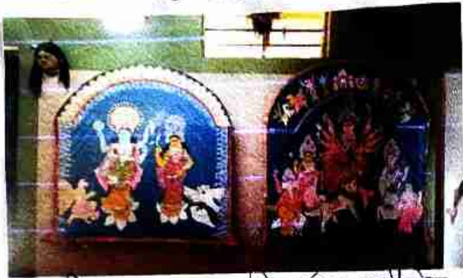
লক্ষ্মী নারায়ণ ও দেবী দুর্গার পটচিত্র

ক) পটচিত্র :- কোন সুবর্ণের বিভিন্ন সিল্ক কলায় গড়ে ছবি অঙ্কন একটি মাঝে ছবিটা আঁকন করতে। পটচিত্র হল একটি কলায় একটি মাঝে আঁকা। সুবর্ণের সমস্তে পটচিত্রের আঁকিয়ে নানান দেবীদেব, নদীদেব চিত্র স্থাপিত হলেও সিল্কীরা, বর্ষা-